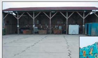
Olomoučanům slouží k bezplatnému odkládání kusového odpadu již několik let dva sběrové dvory.