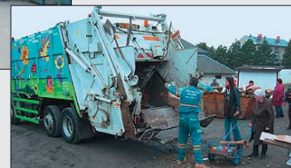
Na stanovištích sběrových sobot je k dispozici obsluha, pracovník TSMO.